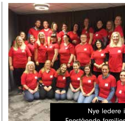
Nye ledere i // Enestående familier

Planene er å invitere inn folk fra IOGT Sandnes, Mestringsenheten, helsesøster, Røde Kors, Hepatiitbussen osv. Jeg har også kontaktet noen musikervenner som vil komme og synge en liten time. Vi har nå over 40 gjester hver uke, og da er det viktig å kunne ha et tilbud til gjestene våre, og ikke minst gjøre det interessant å komme på Kafè Klar.