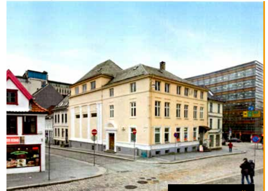
"Engen" // IOGT-huset i Bergen siden 1930

Nå som huset er solgt, er hun glad for at pengene har gått videre til Åsane.